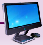
PC 軟體 讀取辨識結果