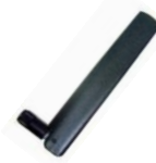
GSM/GPRS 天線 (ANT-421-04)