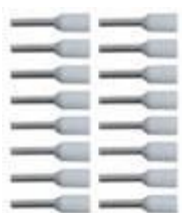
白色端子 * 16