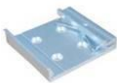
44 mm DIN-Rail 導軌固定架