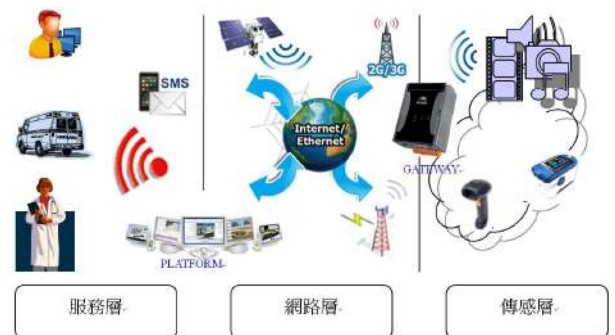
▲ 圖 6 - eHealth 健康照護系統

eHealth 健康照護系統 (圖 6) 使用資訊通訊技術建構遠端健康照護服務應用，eHealth 服務提供者藉由該系統與使用者端交換健康照護訊息。其中 eHealth 閘道 (Gateway) 負責收集各個傳感器量測資料，彙整後再與健康照護平台 (Platform) 交換資訊，醫護人員或是其他 eHealth 服務提供者，可以利用照護平台，分析使用者健康狀況或是提出醫療建議。