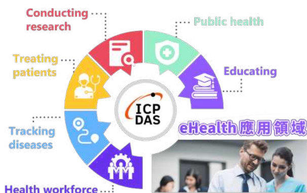
▲ 圖 1 - eHealth 應用領域

類傷亡。例如十四世紀的歐洲黑死病、十五世紀的美洲天花，都造成巨大生命與財產損失。雖然當時醫療技術沒有現代發達，所幸過去受限於交通工具不完備，大陸與大陸間存在天然屏障，減緩病毒擴散。反觀近年來交通工具發展迅速，高速鐵路、飛機技術發達，從而實現天涯若比鄰，這樣方便的現代交通卻也成為疾病傳播的溫床，對防疫造成巨大挑戰。除了經由封鎖減少人員流動，過去使用在動植物入境的隔離檢疫措施也能有效降低傳染病傳播。