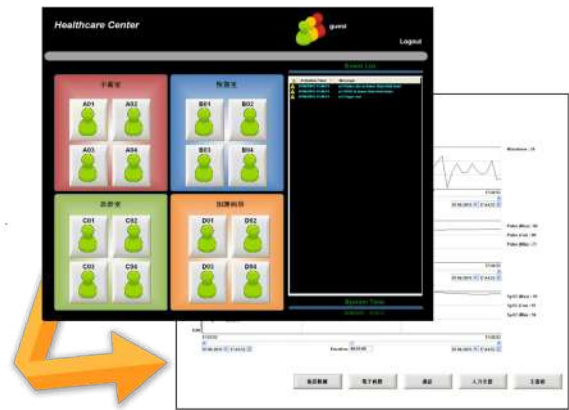
▲ 圖 8 - eHealth 管理平台

eHealth 服務提供者包含直接與間接提供醫療保健服務專業人士或機構，醫生、護理師、健康管理師或看護人員都是常見 eHealth 服務提供者。健康照護平台 (圖 8) 利用資通技術，蒐集傳感器傳回的資料，依據預先設定規則，在數量龐大生理資訊中過濾出需要注意事件，依照事件種類或等級，經由螢幕顯示、聲音警報、手機簡訊或 e-mail 技術即時通知相關人員進行處理。