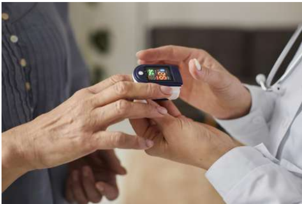
▲ 圖 4 - 脈搏血氧飽和度分析儀

氧氣是維持人體運作重要元素，人體在缺氧狀況下短短數分鐘內就有可能造成不可復原傷害，甚至對生命造成威脅。脈搏血氧飽和度分析儀 (圖 4) 提供了以非侵入式技術量測血氧飽和濃度 (SpO 2 )，不同於抽血採樣分析量測方式，脈搏血氧飽和度分析儀只需將感測器配戴至待測人體血管密集處 (例如耳垂或手指)，就可以即時得到目前血氧飽和濃度及脈搏 (心跳)。