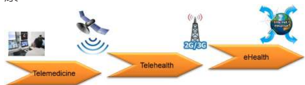
▲ 圖 9 - eHealth 發展沿革

網際網路尚未普及之前，為了解決醫療資源不足或分佈不均勻問題，發展出遠端醫療技術 (Telemedicine)，醫護人員利用電話或無線電通訊技術為遠端病人施實醫療服務，例如 1900 年代初期，利用無線電通訊技術，為南極地區科考站提供遠端醫療服務，爾後又加入電話與影像通訊技術應用。太空時代來臨，遠端醫療也為遠在地面數百公里外的太空人提供醫療服務，利用衛星通訊技術維護太空人健康。