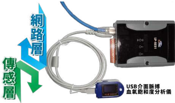
▲ 圖 7 - eHealth 閘道

同，可能會選用不同通訊介面與通訊協定，在傳輸距離、節能續航、傳輸速度與低功率間取捨。eHealth 閘道支援一種或多種傳感器通訊技術，位於網路層與傳感器之間，提供可靠與安全的資料交換途徑。