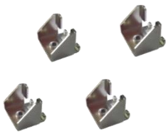
固定鋁件 * 4