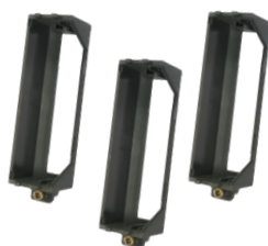
I/O 插槽 * 3