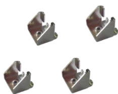
固定鋁件 * 4