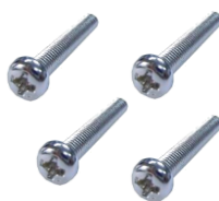
M4 x 30L 螺絲 * 4