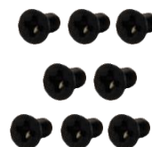
M3x6L 螺絲 x 8