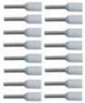
歐式壓著端子 x 16