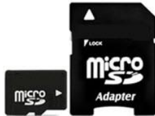
microSD 卡及 micro SD/SD 轉接卡