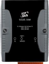
WISE-5800 或 WISE-5800-MTCP