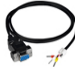
RS-232 纜線 (CA-0910)