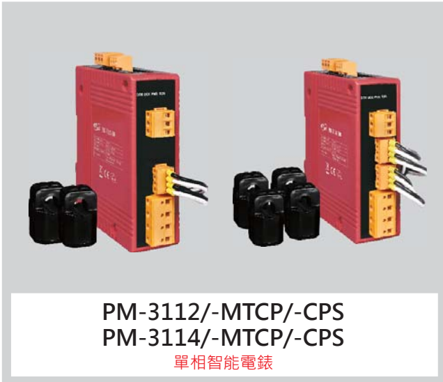
PM-3112/-MTCP/-CPS PM-3114/-MTCP/-CPS 單相智能電錶